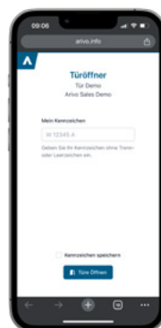
2. Kennzeichen eingeben