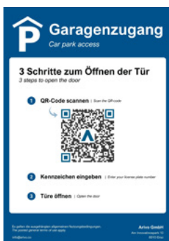
1. QR-Code scannen